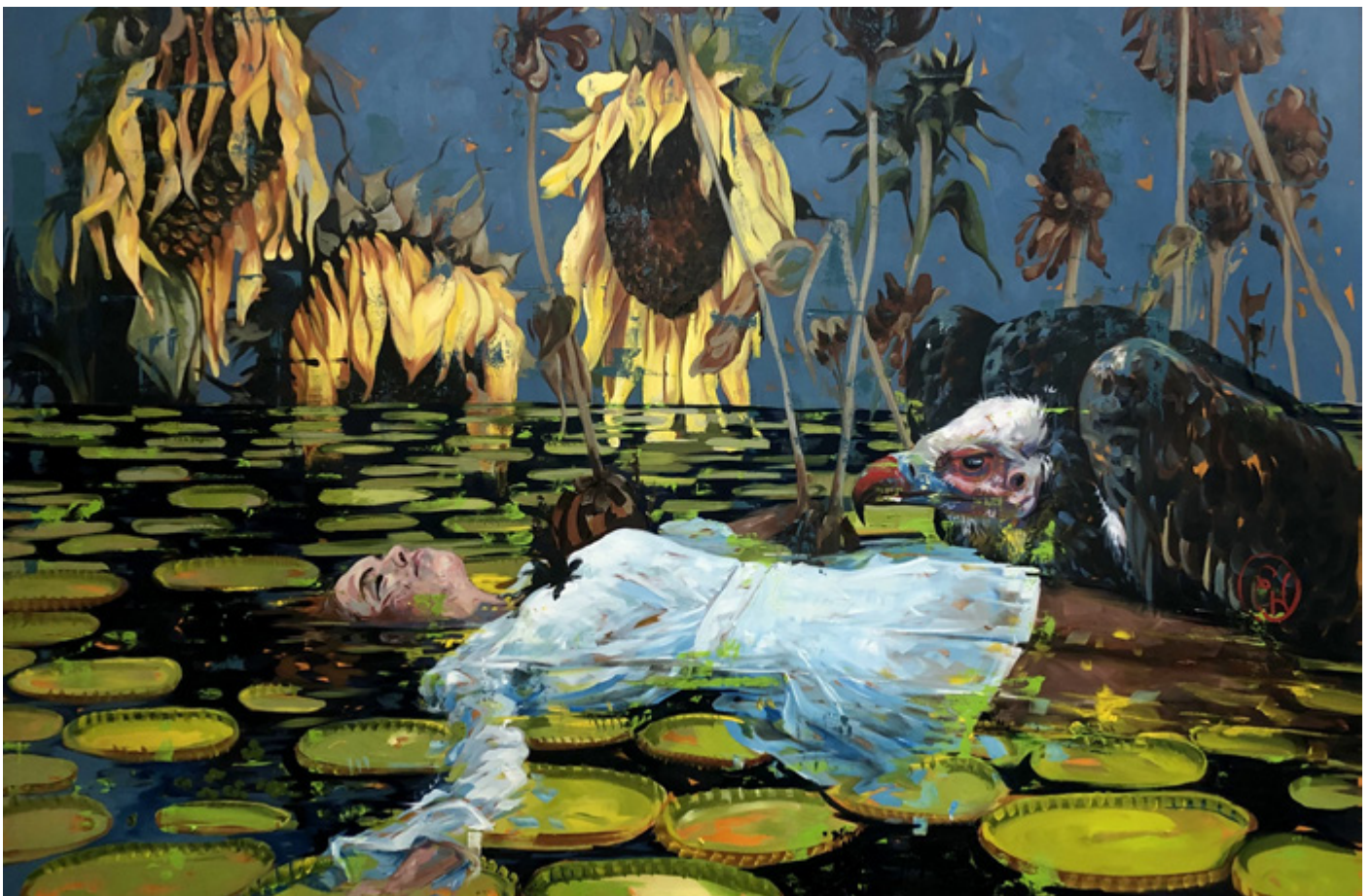
Les 7 péchés capitaux, - La paresse 2021, 140x175 cm, Huile sur toile, ambre et pierre noire, papier marouflé sur toile

L'enfance dépossédée d'elle même, face à un monde brutal. L'actualité faite d'images violentes cotoient ici des enfants; qui en deviennent les acteurs dans des peintures qui nous font réagir, qui nous questionnent en nous mettant face à face avec cette violence.