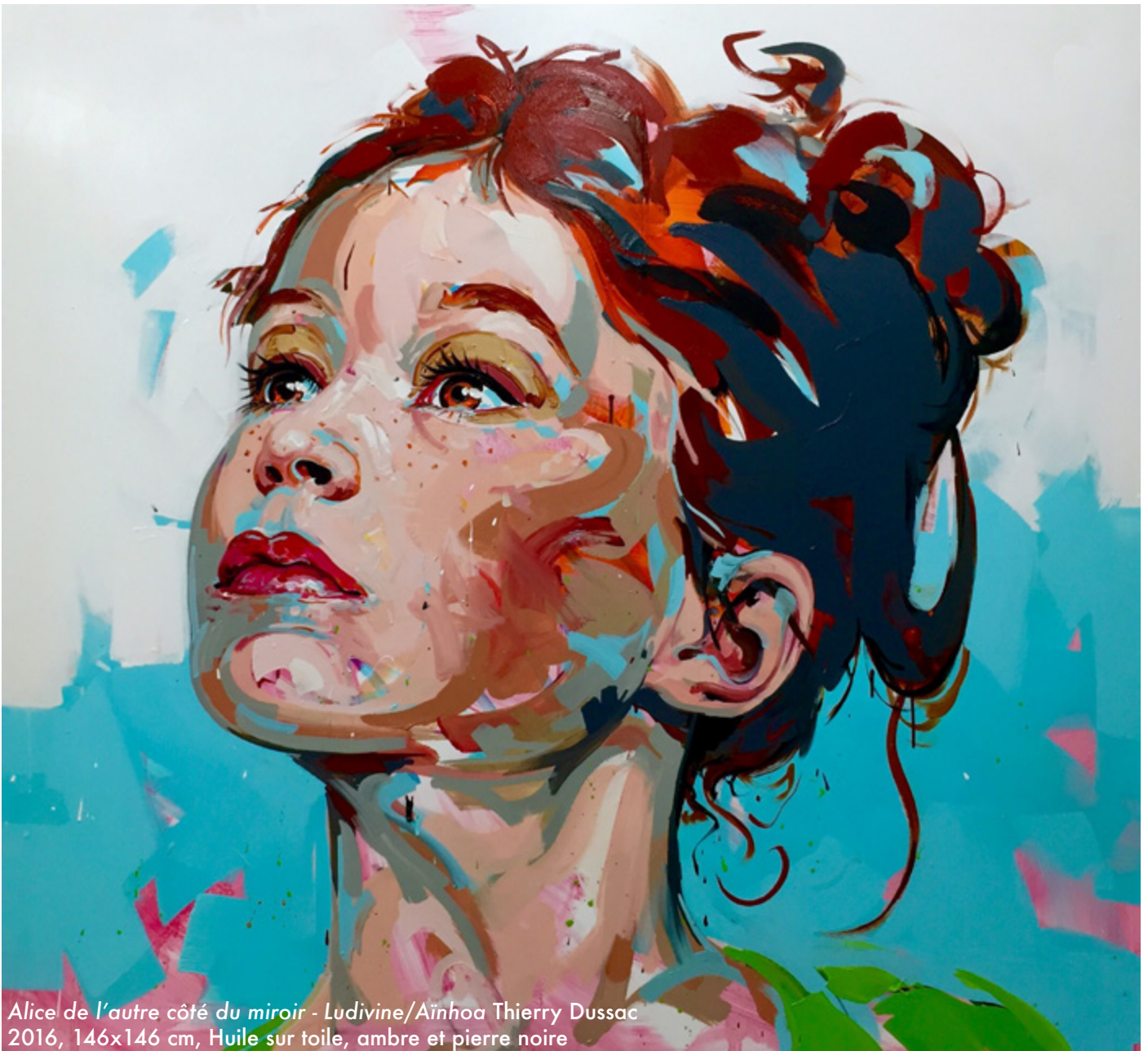
Alice de l'autre côté du miroir - Ludivine/Aínhua Thierry Dussac 2016, 146x146 cm, Huile sur toile, ambre et pierre noire