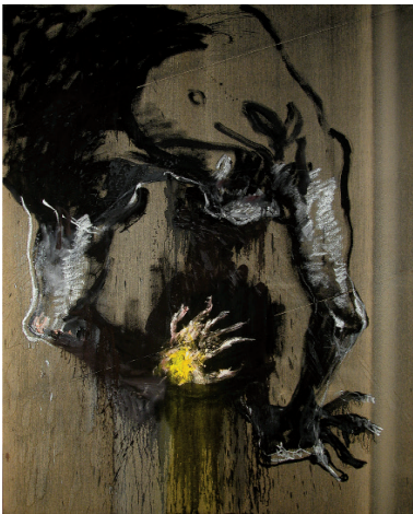
Lydie Arickx Le passeur de lumière Huile sur toile émri, 293x20cm

Lydie Arickx et Nurcan Giz, au-delà des limites, du 03.10.21 au 28.11.21