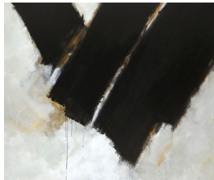
Nurcan Giz Sans titre, Techniques mixtes, 100X120cm