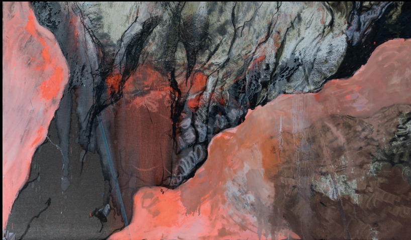
Au delà des limites