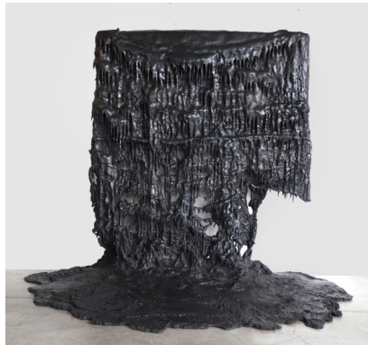
Lydie Arickx Le Mur d'eau bronze, 130cm