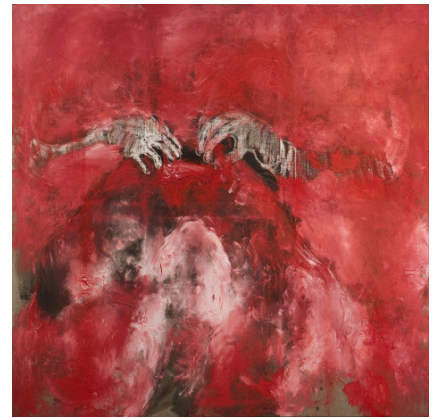
Lydie Arickx La Peur , 2011 Huile et pigment sur toile, 200x200cm