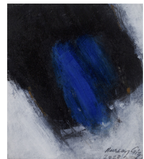
Nurcan Giz Sans titre, Techniques mixtes, 12x10cm