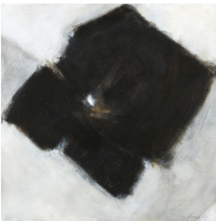
Nurcan Giz Sans titre, Techniques mixtes, 60x60cm

Artiste multiple, elle travaille aussi les volumes, avec des sculptures en bronze, ou les fluides et les mouvements du corps semblent figés dans la matière.